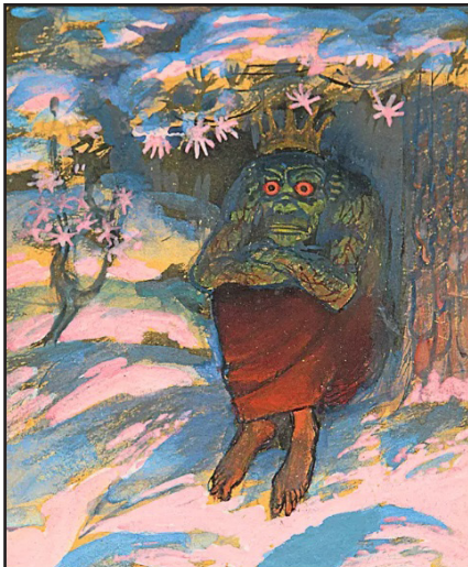
Historicus ordförande 2022