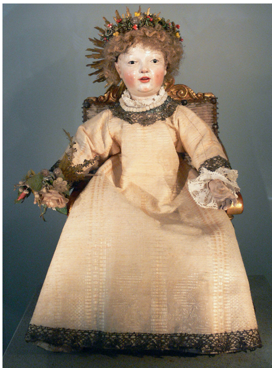
Kristusbarnet, en av flera orsaker till jultomtens antityskhet.

Jultomten har även använts i polsknationalistisk revanchism, inte minst eftersom hans röda och vita dräkt har polska färger. I revisionistisk historieskrivning beskrivs hur han julen 1942 slog Hitler på käften och sedan sköt ihjäl honom. 13 Det kan tänkas vara överdrivet, men det verkar rimligt eftersom det anspelar på en tidigare representation av antityskhet hos S:t Nikolaus. 14