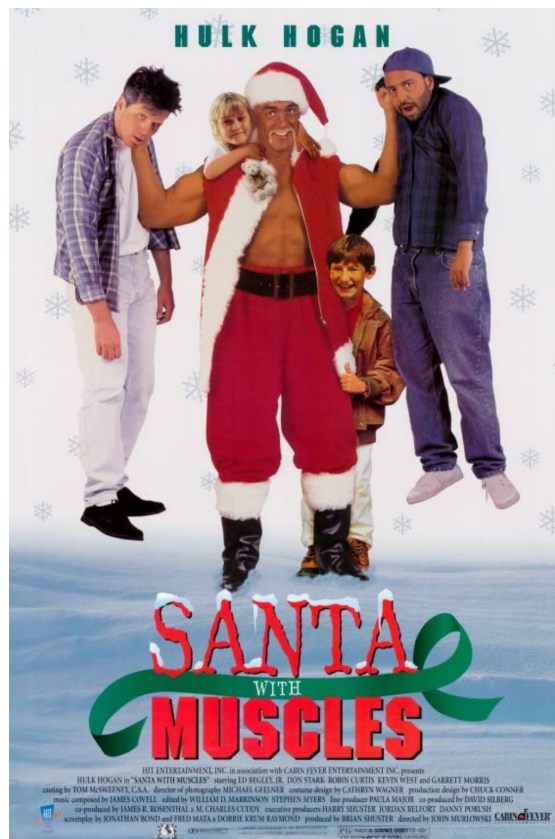
1990-talsikon som hänvisar visuellt till det första konciliet i Nicaea. (Murlowski 1996.)