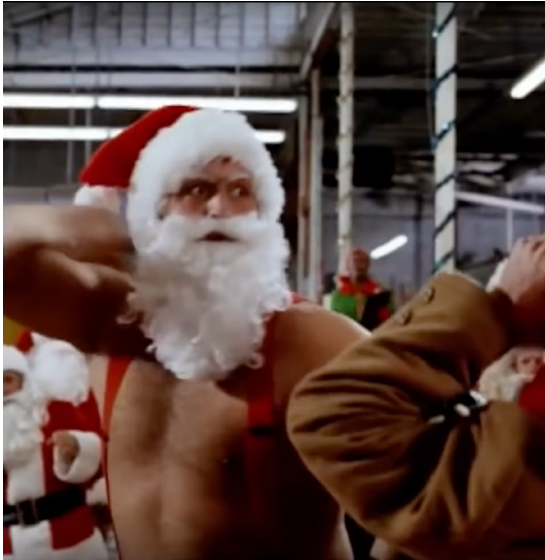
1990-talsikon som hänvisar visuellt till det första konciliet i Nicaea. Arius representerad av den österrikiske tyskspråkige Arnold Schwarzenegger. (Levant 1996.)

S:t Nikolaus förknippas ofta med den nutida legendariska personen jultomten. 2 Jultomten verkar ha mirakulösa krafter eftersom han kan dela ut presenter till alla kristna barn i världen under en dag och en natt, vilket låter som ett resonligt mirakel för ett helgon känt världen över, även om hagiografier sällan upprepar samma mirakel årligen. Inget säger emot att han är densamme S:t Nikolaus, dömd till ett tillsviðare oändligt liv på jorden som ett Guds straff på samma sätt som Kain eller den vandrande juden ur en kristen legend, annat än att evigt liv på jorden just är ett straff (främst för judar) och Nikolaus som helgon torde vara tadelfri i Guds ögon. 3 Om han då är odödlig eller ovanligt långlivad