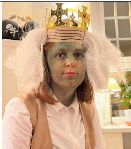
Axel Gallén "Hiisi" 1899 gouache på papper