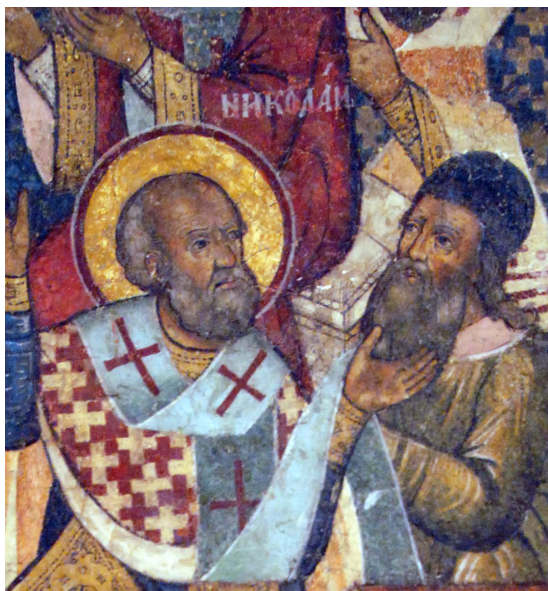
Detalj ur en medeltida grekisk-ortodox ikon där S:t Nikolaus örfillar Arius vid det första konciliet i Nicaea.

S:t Nikolaus dödsdag och därmed festdag är för övrigt den 6 december i den gregorianska kalendern vilket antyder en länk mellan honom och självständighetsbisin som är en bekant del av helsingforsiska svenska historiestuderandes religiösa tradition.