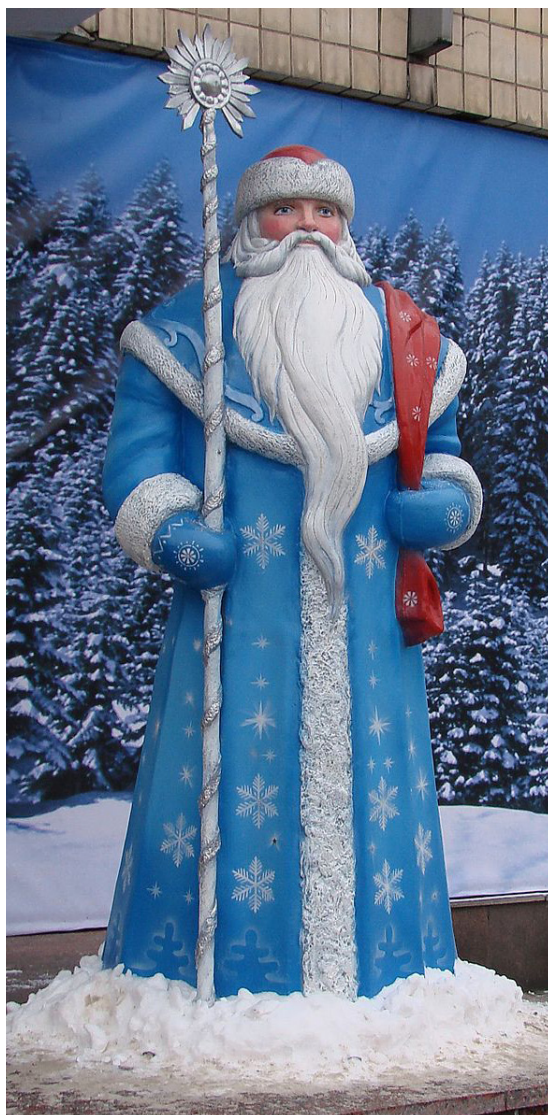
Farfar Frost. En antijultomte, eller jultomten i förklädnad? ("Ded Moroz" s.a.)

Den ikoniska röda klädseln var dock redan standard innan Haddon Sundbloms avbildningar av honom för Coca-Colas räkning gjorde den världskänd. 8 Det verkar dock rimligt att valet av rött är en konsekvens av den förhärskande rovkapitalismen och den extrema ekonomiska tillväxten i USA kring sekelskiftet. 9 Man kan spekulera att den är ett av många försök bland kapitalister att appropriera socialistisk symbolik. Hans röda färg blev förknippad med konservativ kapitalism på samma sätt som USA:s republikaner använder rött i sin symbolik. Den internationella kommunismens motdrag under Sovjetunionens ledning var då att på samma sätt som USA:s demokrater använda blått i sin socialistiska julgubbe Farfar Frost (Дед Мороз). 10 Inget säger dock emot teorin att Farfar Frost bara är S:t Nikolaus som lanserat ett alternativt brand i den sovjetiska intressesfären där efterföljandet av kapitalistiskt julfirande inte var önskvärt. 11 En intressant utveckling under senare år är att S:t Nikolaus fått mera utrymme i postsovjetiska stater, speciellt Ukraina, som ett avståndstagande från Ryssland och kanske ett ställningstagande för kapitalismen om än inte katolicismen. 12